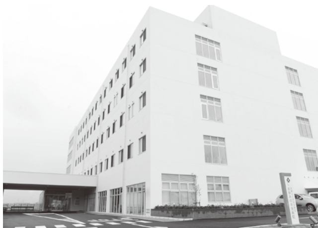
おゆみの中央病院 千葉県千葉市緑区おゆみ野南6-49-9 Tel.043-300-3355