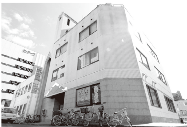
患者の自立に力を入れる「おゆみの整形外科クリニック」