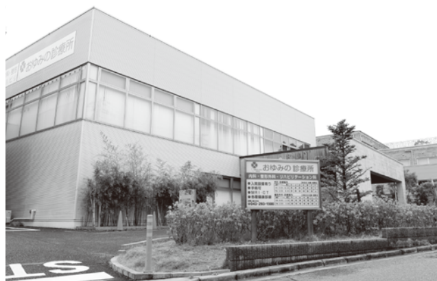
内科・外科・消化器内科を標榜する「おゆみの診療所」